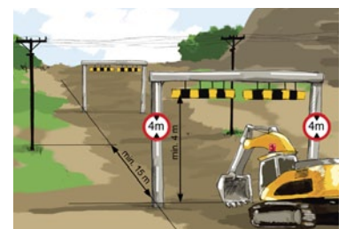
Rys. 2. Bramka ograniczająca wysokość przejazdu